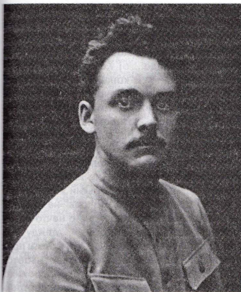
Д. А. Фурманов

был принят на юридический, затем переведен на историко-филол. ф-т Московского ун-та. Не завершив образования, в 1915 ушел добровольно служить братом милосердия на санитарных поездах Земского союза, побывал на Кавказе, в Сибири, на Западном и Юго-Западном фронтах. В окт. 1916 демобилизовался и поселился в Иваново-Вознесенске, где стал преподавателем рабочих курсов.